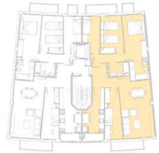
C/ NARCÍS OLLER

Rambra Nova n°18 baixos · Tarragona Tel. 977 252 052 · www.finqestarragona.com